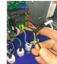
схема подключения ТРК.

От EXZ 1.0 В разрыв черного кабеля (фаза клапана) фишка X12